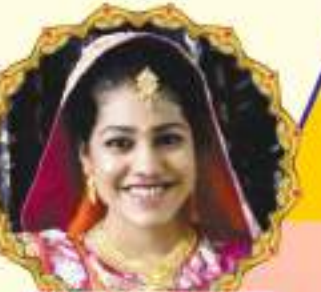
દ્રષ્ટિબેન (૨૦ વર્ષ)

મહા સુદ ૫ (વસંત પંચમી), સોમવાર, તા. ૨૨-૧-૨૦૧૮ ના શુભદિને