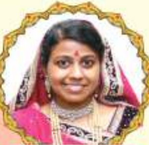
વિરલબેન (૩૧ વર્ષ)