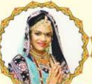
ખુશબુબેન (૧૮ વર્ષ)